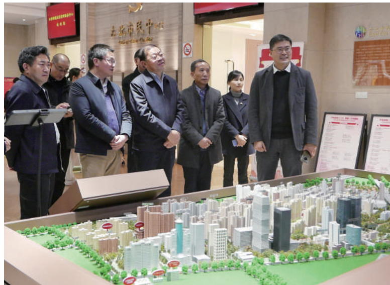
◎ 淮安市人大常委会领导带队调研全过程人民民主实践基地建设情况。

高沟问政是淮安人大努力向大局大势靠拢的缩影。市人大常委会充分践行“监督+”履职理念，项目选定上瞄准重点、难点、关键点，方法选择上多走创新路、善打组合拳、形成闭环式，监督支持有机统一，刚性温度融合互促，扎实助推重大战略、工程、项目加快实施，使监督工作“出力”更“出圈”。