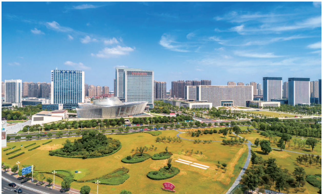
● 淮安新城生态风景全貌。