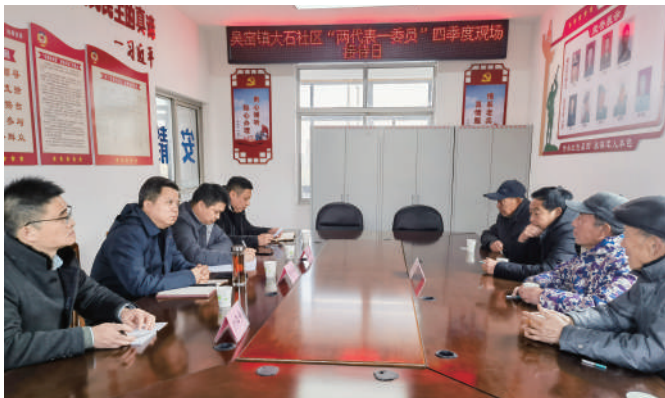
◎ 吴窑镇大石社区“两代表一委员”四季度现场接待日。

创新联络方式,多元化延伸联系触角。为充分发挥人大代表联系群众作用,将代表职能延伸到全镇52个网格,在网格中亮身份、解难题、树形象。探索“联络点+网格+基层社会治理”模式,形成“点、格”有机结合的工作网络。以“战高沙强履职,‘五心五一’展作为”主题活动为契机,代表们通过开展走访调研、接待群众、结对帮扶等形式密切联系群众,充分发挥基层治理“宣讲员”“信息员”“协调员”“服务员”“监督员”的作用。据不完全统计,换届以来,代表们围绕理论政策、法律法规、乡风文明等累计宣讲90余场。参与疫情防控、文明典范城市创建和人居环境整治等各类志愿服务360余场,累计结对帮扶150余人次,走访慰问530余人次,协助化解群众纠纷130余起,充分打通人大代表服务群众“最后一公里”,助力提升基层治理水平。