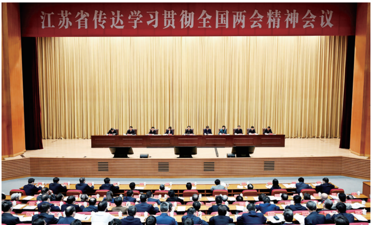
◆ 3月15日,我省召开传达学习贯彻全国两会精神会议。省委书记、省人大常委会主任信长星传达习近平总书记参加十四届全国人大一次会议江苏代表团审议时的重要讲话和在全国两会上的重要讲话精神,并就学习贯彻工作提出要求。