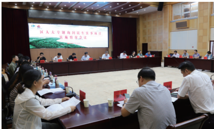
◎ 洪泽区人大专题询问民生实事项目实施情况。