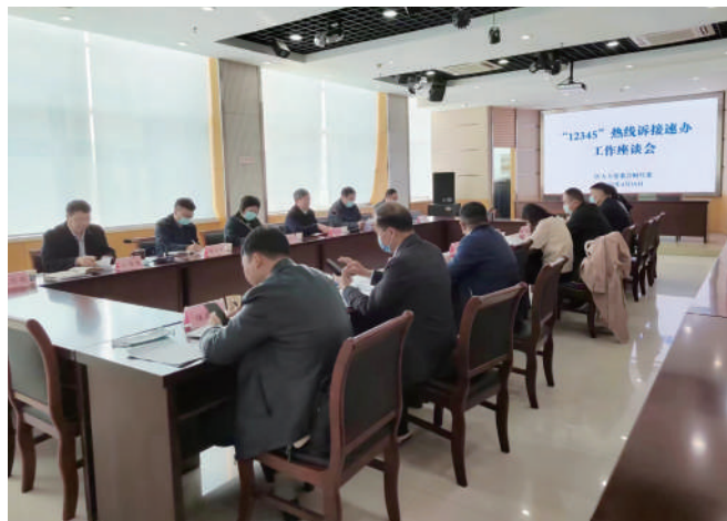
◎ 清江浦区人大召开“12345”热线诉接速办工作座谈会。

问题导向,把监督的“根”筑牢在整改落实。实施问题清单销号管理。对发现的一般性问题采取“即促即改”的原则,专业代表第一时间将问题传递给责任单位,督促其立即整改。对于较为复杂的问题,推行“三张清单”制度,即“问题清单”“整改清单”“销号清单”,