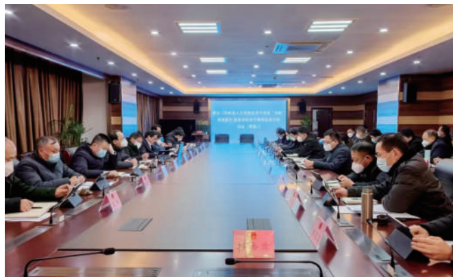
◎ 盱眙县第十八届人大常委会第八次会议作出激发“四敢”决议。

组合行使权力，跟踪直至见效。县政府制定了《关于突出“四敢”导向 激发全县干事创业活力的实施意见