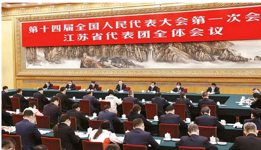
◎ 3月5日,中共中央总书记、国家主席、中央军委主席习近平参加他所在的十四届全国人大一次会议江苏代表团审议。

江苏代表团审议认真,气氛热烈。许昆林、刘庆、单增海、魏巧、张大冬、吴庆文等6位代表分别就服务全国构建新发展格局、大力推进区域协同创新、坚定不移向制造业高峰攀登、当好新时代“新农人”、为党育才、当好中国式现代化建设排头兵等问题发言。习近平不时插话,同大家展开交流。