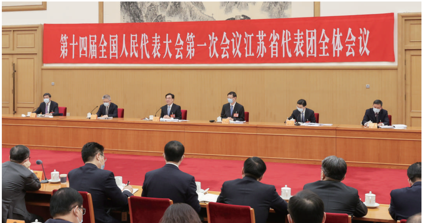
◆ 3月6日上午,十四届全国人大一次会议江苏代表团举行全体会议,专题学习习近平总书记参加江苏代表团审议时的重要讲话精神。省委书记、省人大常委会主任、代表团团长信长星主持会议并讲话。