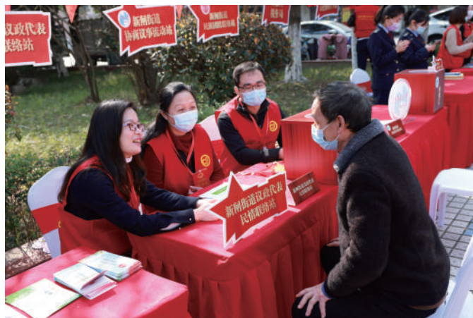
◎ 新闻街道人大代表、议政代表在流动民情联络站接待选民群众。

新闻街道工委进一步拓展和延伸代表联络站功能,让站点成为反映情况的民意窗、化解矛盾的助推器、学习培训的充电站。每月10日,代表们“进站”接待群众,以“接诉即办”为原则,根据实际情况对问题进行分类分级转交,并对处理结果进行登记反馈,确保来访有登记、问题有答复、结果有反馈。同时,代表们深入基层、积极“出站”走访,聚焦群众关心关注热点问题开展专题调研、政策宣传、学习交流、民生实事征集等活动,让群众切身感受到代表就在身边。