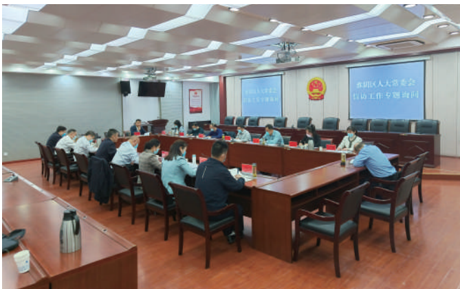
◎ 淮阴区人大开展信访工作专题询问。

聚焦条例执行,绘好“工笔画”。“点”上聚力。针对群众反映的具体民生问题,注重发挥“与民同行”代表履职平台作用,及时安排区人大各委室和镇街人大召开“与民同行”座谈会、议政会和问效会,先后共推动了20余件涉及民生信访问题的有效化解。“线”上延伸。针对国省交办的典型信访问题,检查组专门邀请法律、信访等方面的专业人员以及人大代表共同参与个案解剖、探讨和研究,并提出有针对性的化解意见。去年全