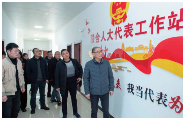
◎ 金湖县人大常委会领导调研走访“家站点”建设。

民心暖: 做好民生保障,力解“一老一小”难题。民生实事项目实施的进度如何、质量如何,直接关系到金湖县37万老百姓的安全感、幸福感、获得感。为此,金湖县人大常委会举全县人大之力、组织强大阵容投入年度民生实事项目的专项监督。明确组建10个县人大代表监督小组,人员构成包括县人大及其常委会的7个委办,40名县人大代表,对10项民生实事实施项目进行