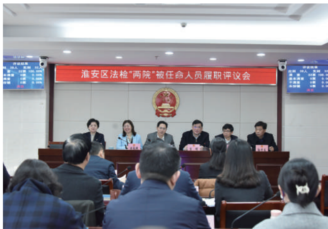
◎ 淮安区人大召开法检“两院”被任命人员履职评议会。

《关于进一步加强“两院”被任命人员履职评议实施工作的试行意见》等一系列实施意见及办法,对监督的对象、内容、程序和结果运用等重点环节进行了规范,保障听取和审议履职报告、评议、调研等监督举措规范实施、有章可循。监督全覆盖。不断探索对法检“两院”被任命人员履职监督的有效途径,建立了“321”监督机制,形成了全覆盖的监督网格,全面实现有任命就有监督。测评面对面。每年年初组织召开法检“两院”被任命人员履职评议会,会上“两院”被任命人员报告工作,常委会组成人员“面对面”点评,并进行满意度测评。2019年起,创新性开启“双随机双报告”履职监督新模式,在法检“两院”被任命人员履职评议会上,现场抽取被测评人员报告履职情况,通过随机滚动式抽签,实现了区人大常委会对法检“两院”被任命人员履职监督届内全覆盖。