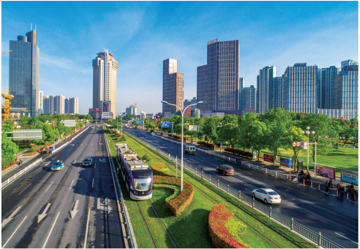
● 清晨在城市中“奔跑”的有轨电车。