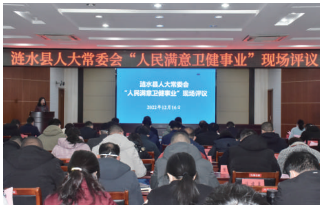
◎ 涟水县人大开展“人民满意卫健事业”现场评议活动。

施情况专题询问会上,9名区人大代表就上半年9个项目实施情况进行询问,区8个牵头单位负责人逐一答复,对进展较慢的项目明确推进措施。会后,区人大办会同相关专委会列出问题清单,交由区政府和有关部门整改落实,实行逐项“销号”处理。