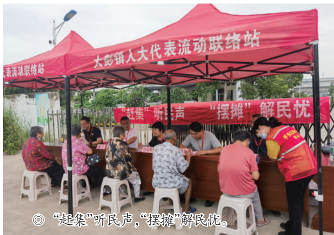
◎ “赶集”听民声，“摆摊”解民忧。

铜山区人大按照“一镇一品牌、一站一特色”的原则，创新“流动代表联络站”工作品牌，明确代表当好“民情信息员”“民事调解员”“政策宣传员”“暖心代办员”等4方面20项工作内容，引导代表服务群众用心、答复诉求用心、化解矛盾用力。目前“流动代表联络站”工作品牌已在全区推广。