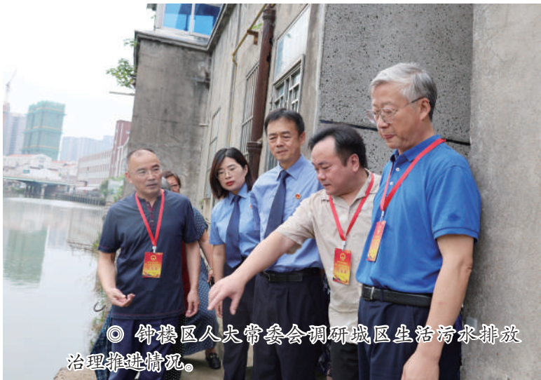
◎ 钟楼区人大常委会调研城区生活污水排放治理推进情况。