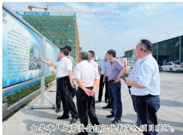
◎ 如皋市人大常委会组织代表深入项目现场。