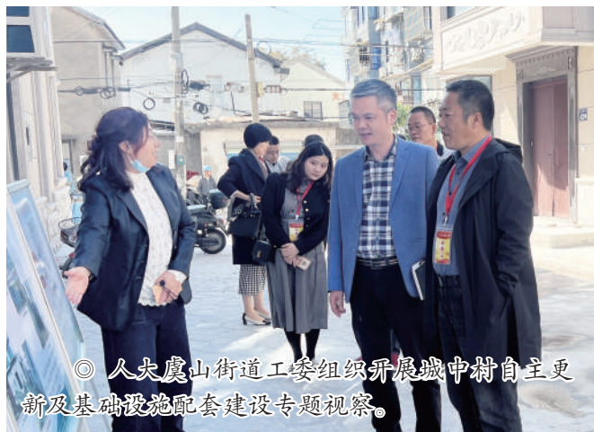
◎ 人大虞山街道工委组织开展城中村自主更新及基础设施配套建设专题视察。

打造“实事常办”会客厅。“虞话坊”凝民心。以4个代表工作站、44个代表联系点和45个村社区服务中心为载体,每个“虞话坊”工作站每月举办活动两次,每次安排2—3名代表接访群众。今年以来,已有230余人次参与,收集意见建议200余条。“虞山问政”汇民意。组织开展“虞山问政”直播品牌,人大代表和群众面对