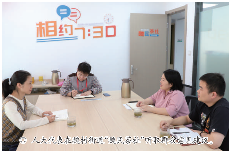
◎ 人大代表在魏村街道“魏民茶社”听取群众意见建议。