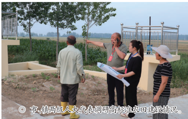
◎ 市、镇两级人大代表调研高标准农田建设情况。