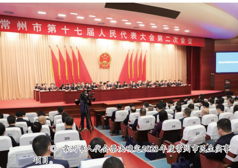
◎ 常州市人代会票决确定2023年度常州市民生实事项目。

常州市各级人大在全力推动民生实事项目落地落实的同时,坚持制度建设、机制创新,以数字化改革为牵引,做实基层民主底色、突出人大履职本色、淬炼数字赋能成色,进一步擦亮了常州代表票决制工作品牌,形成了“党委决策更加科学民主、人大依法监督更加务实有效、政府为民执政更加积极主动”的良好局面,全力打造践行全过程人民民主的“常州样本”。