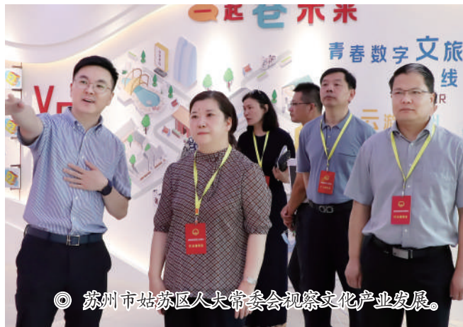
◎ 苏州市姑苏区人大常委会视察文化产业发展。

市域一体化是完善市域空间布局,提升城市能级的重要部署。区人大常委会联合工业园区人大工委开