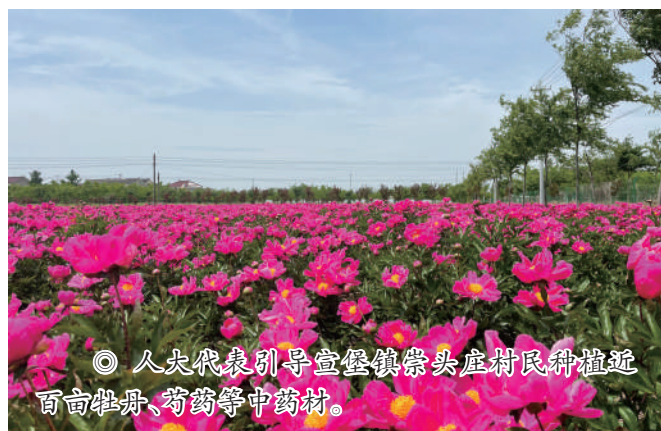
◎ 人大代表引导宣堡镇崇头庄村民种植近百亩牡丹、芍药等中药材。