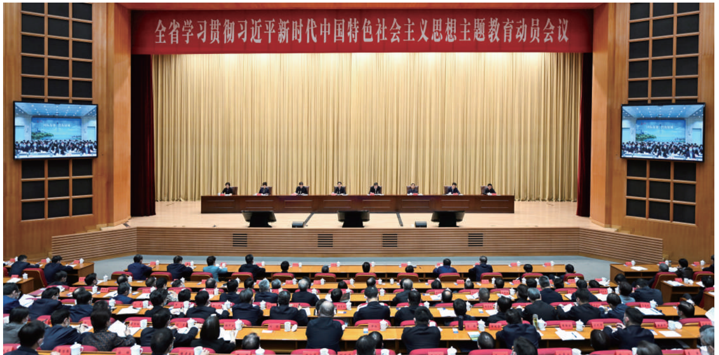
◆ 4月10日,全省学习贯彻习近平新时代中国特色社会主义思想主题教育动员会议召开。省委书记、省人大常委会主任信长星,中央第六指导组组长杜家毫出席会议并讲话。