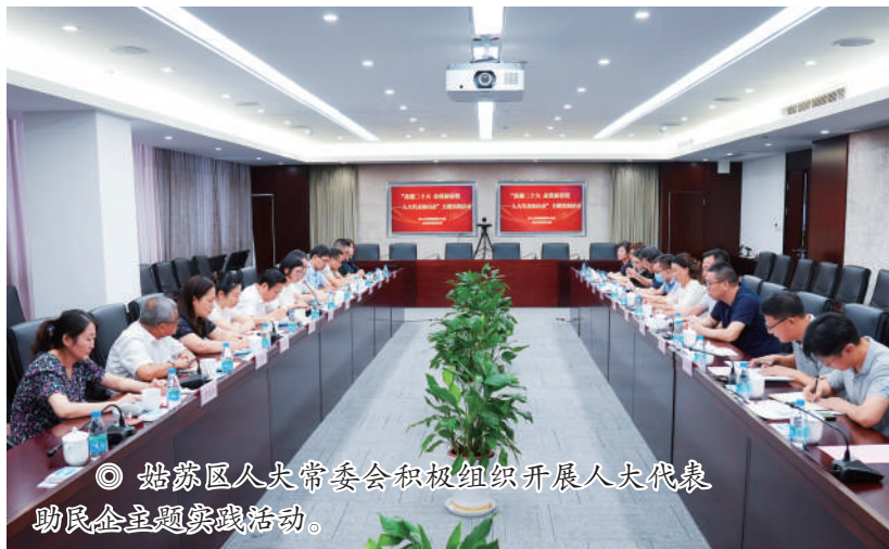
◎ 姑苏区人大常委会积极组织开展人大代表助民企主题实践活动。

始终围绕中心大局,在助推经济高质量发展中吸纳民意、汇集民智。姑苏区人大常委会坚决贯彻以人民为中心的发展思想,积极组织“喜迎二十大 奋进新征程”主题实践活动,在人大代表助民企主题实践活动中创新活动形式、增强活动实效,进一步发挥了代表联