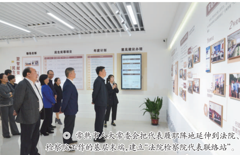
◎ 常熟市人大常委会把代表履职阵地延伸到法院、检察院工作的基层末端,建立“法院检察院代表联络站”。

2022年以来,太仓市人大常委会依托全市社会综合治理网格优势,创新开展“人大代表网格化履职”探索闭会期间代表履职新路径,实现“代表来自选区,网格就在选区,履职依托网格”,使代表深入基层联系选民,深度参与基层治理,筑牢全过程人民民主“根系工程”。