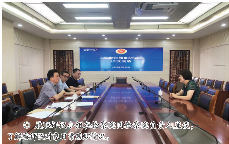
◎ 履职评议小组在检察院同检察院负责人座谈,了解被评议对象日常履职情况。

坚持四项原则。坚持依法监督原则,依法履行宪法法律赋予人大的职权,进一步加强“两官”任后监督。坚持客观公正原则,精选参与评议工作的有关人员,确保监督工作公平、公正、客观,评议意见“画像精准”。坚持以民为本原则,注重抽查反复上访、超审限久拖不