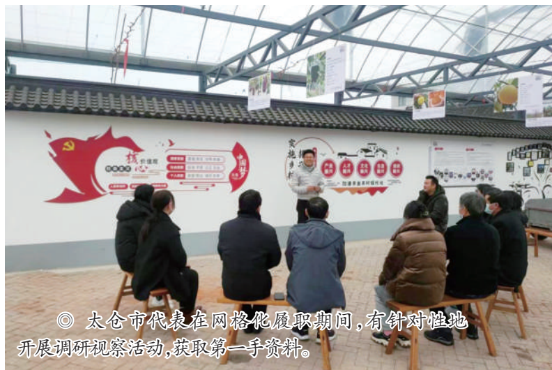
◎ 太仓市代表在网格化履职期间,有针对性地开展调研视察活动,获取第一手资料。