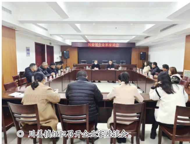
◎ 川姜镇组织召开企业家座谈会。

大主席团召开的专题座谈会，企业提出了招工难、成本高等问题。对此，人大代表积极建言献策，围绕交通更便捷、教育更优质、医疗更温暖、人才配套服务更完善、品牌效益提升等提出建议、凝聚共识。镇人大主席团进一步强化对相关行政审批职能部门的监督，推进“放管服”改革，优化服务意识，通过“法律服务团+基层司法所”结对模式，形成“会诊报告”并落实回访制度，促进行政执法部门提升执法质效。