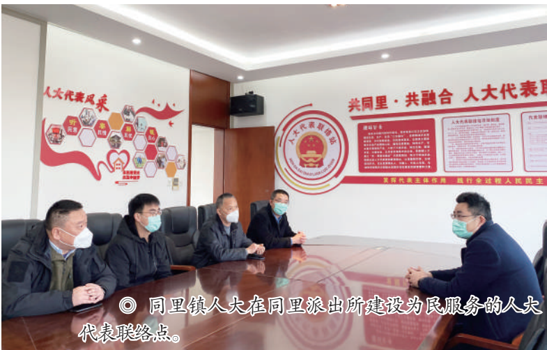
◎ 同里镇人大在同里派出所建设为民服务的人大代表联络点。