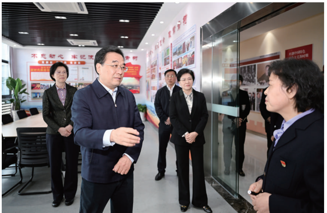
◆ 4月11日,省委书记、省人大常委会主任信长星深入南京的长江岸线、企业、街道、乡村,围绕开展学习贯彻习近平新时代中国特色社会主义思想主题教育进行督导并调研。