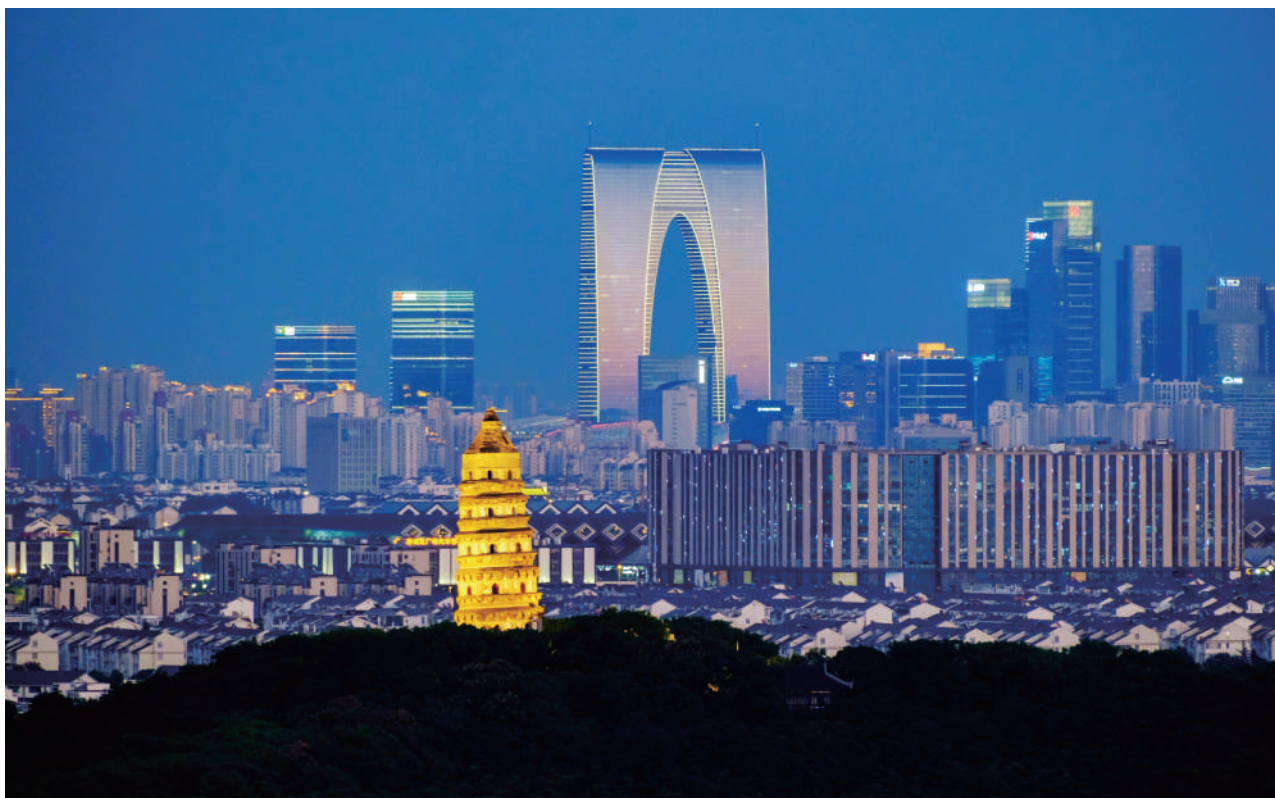
● 古今遥相辉映的苏州。