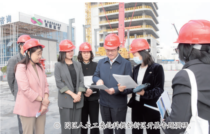
◎ 园区人大工委赴科教创新区开展专题调研。

时刻围绕园区在中国式现代化建设中打造开放创新的世界一流高科技园区的目标要求,自觉把各项工作放到园区发展大局中进行创新性谋划与推进,坚持寓人大监督于主动服务之中。通过发挥园区人大工委的调研、问询、建言、督查、督办等职能作用,更好地将苏州市人大对园区发展的监督服务工作延伸并落细落深落实,也使园区人大工委的制度优势转化为园区的区域治理效能,更好地为园区作为国家级经开区、高新区以及自贸试验片区的高质量经济发展、高水平社会治理的创新实践保驾护航。