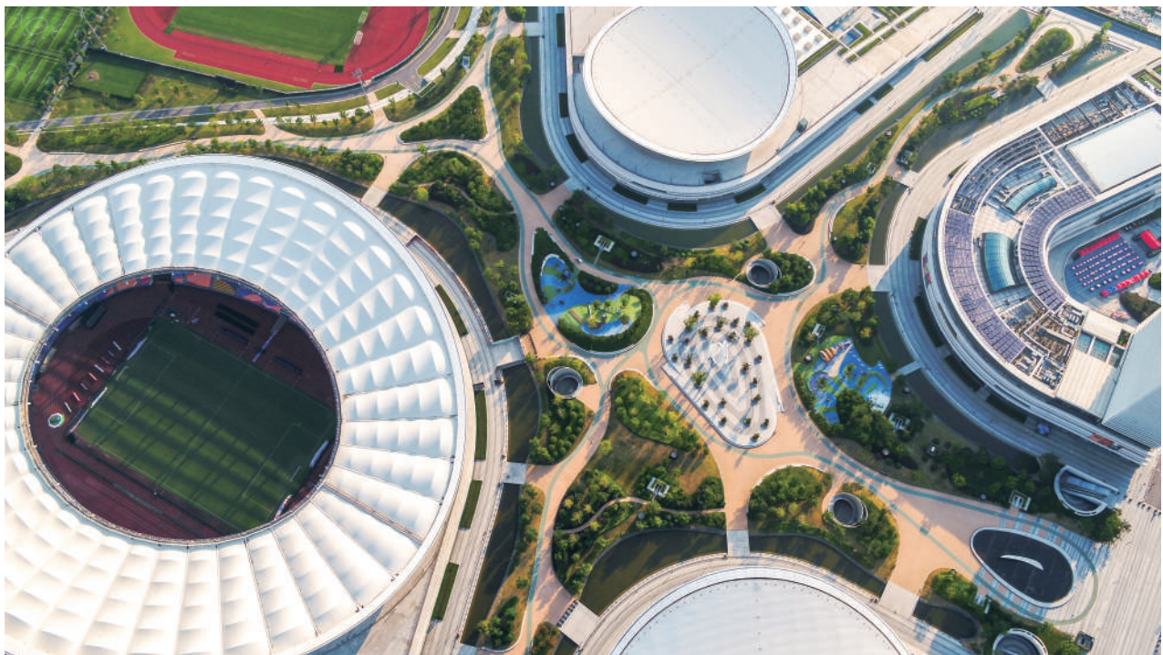
● 俯瞰苏州奥体中心。