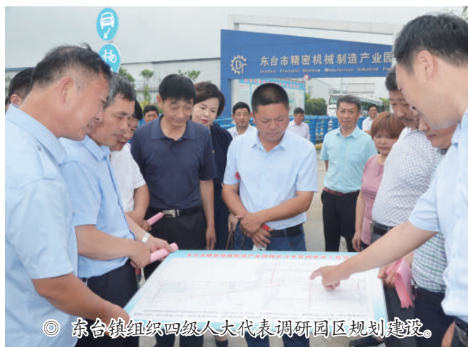
◎ 东台镇组织四级人大代表调研园区规划建设。