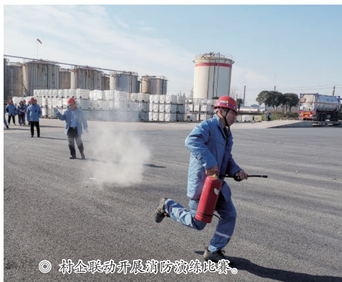
◎ 村企联动开展消防演练比赛。

《江苏省安全生产条例》自2016年施行以来,对加强全省安全生产监督管理工作,预防和减少生产安全事故,有效保障人民群众生命和财产安全,促进经济社会高质量发展发挥了重要作用。此次条例修订,根据新形势新要求,对2016年的安全生产条例作了进一步的补充、完善。概括起来说,这部法规有以下几方面特点:一是贯彻落实党和国家最新决策部署。认真贯彻习近平总书记就切实做好安全生产工作一系列重要指示精神,根据国务院关于推进安全生产领域改革和发展的意见,对我省安全生产工作作出切合实际的法规性制度安排。二是充分体现江苏地方特色。总结提炼了一批江苏特色做法,把经过实践检验证明的创新成果、有效措施,提炼、固化、上升为法规制度规范,推动制度创新。三是着力解决实际问题。全省安全生产工作保持平稳健康的发展态势,但对标党中央国务院要求,对标全省高质量发展走在前列的需要,安全生产工作还存在不少困难和问题。条例坚持问题导向,聚焦安全生产工作现实问题加以规范解决。四是切实增强可操作性。安全生产法于2021年进行了第三次修改。虽然是部分修改,但修改幅度比较大,涉及条文比较多,增加了许多新内容。修订后的安全生产条例,贯彻新修改的安全生产法的相关要求,建立健全安全生产责任体系,构建安全风险防范机制,进一步细化相关