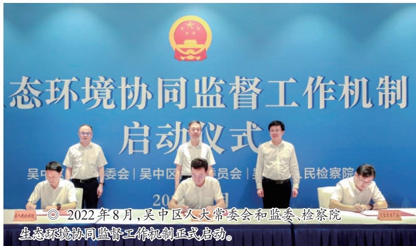
◎ 2022年8月,吴中区委、人大常委会和监委、检察院生态环境协同监督工作机制正式启动。