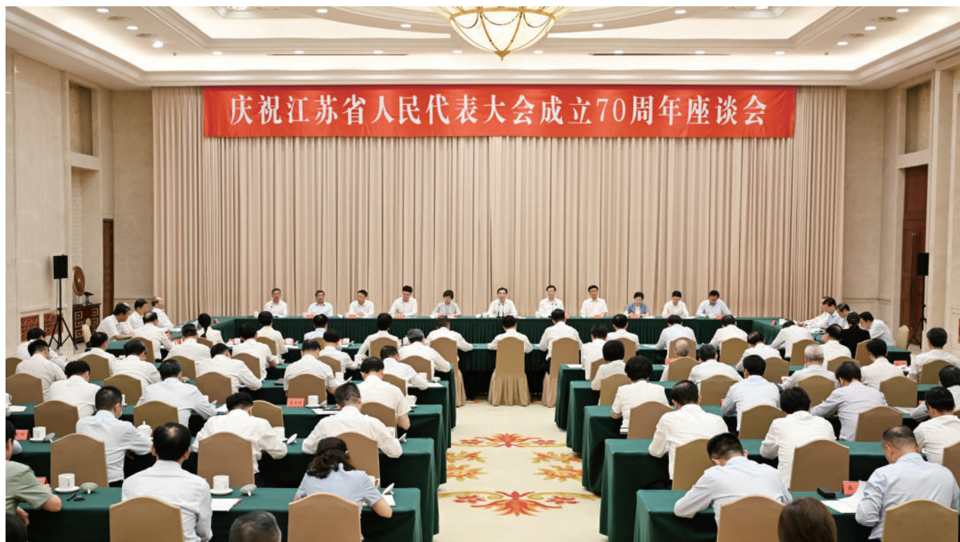
◆ 9月19日,庆祝江苏省人民代表大会成立70周年座谈会在南京举行。省委书记、省人大常委会主任信长星主持座谈会并讲话。