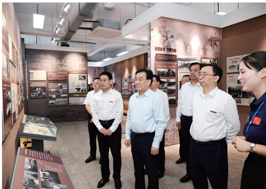
◆ 9月20日,省委书记、省人大常委会主任信长星到南京航空航天大学调研。