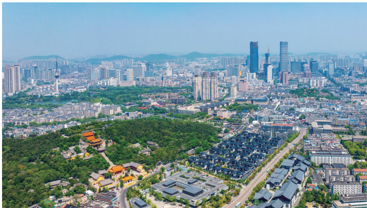
● 徐州市历史文脉-彭城七里