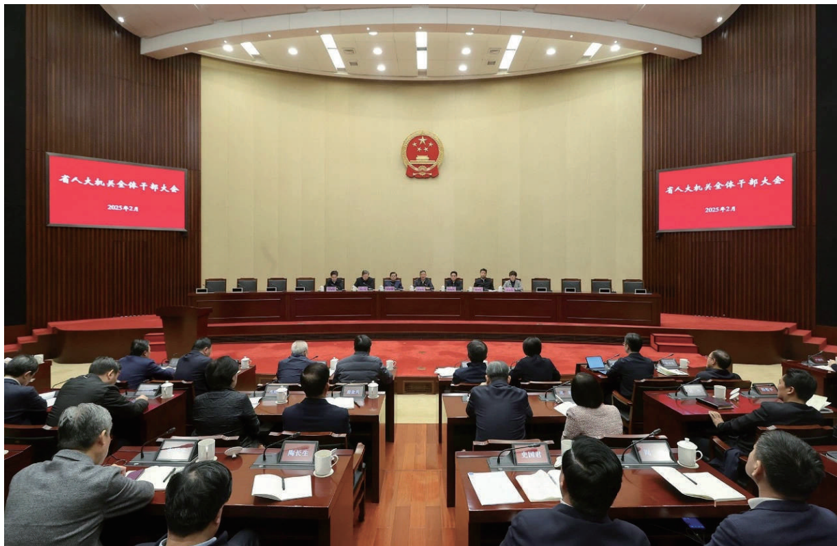
● 2月20日,省人大常委会召开机关全体干部大会,部署推动新一年人大工作。省人大常委会常务副主任、党组书记樊金龙出席会议并讲话。