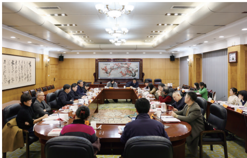
● 今年是省人大机关刊物《人民与权力》杂志创刊40周年。2月24日,杂志创刊40周年座谈会在省人大机关举行。