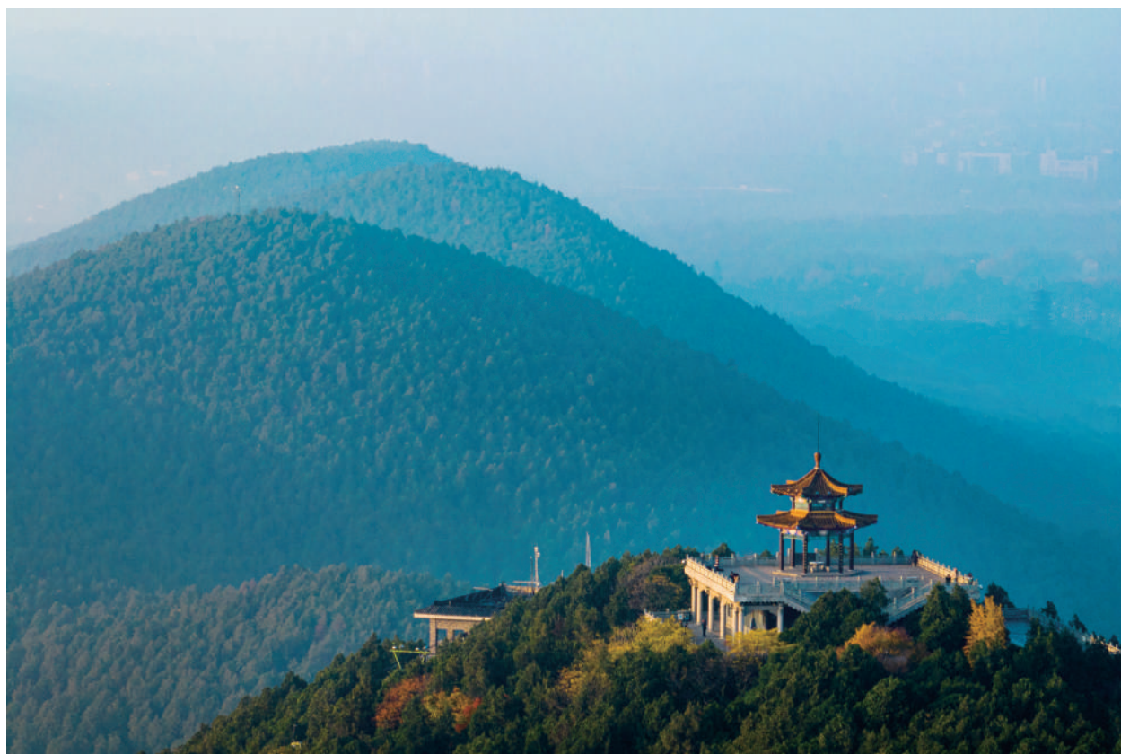
● 徐州市云龙山观景台