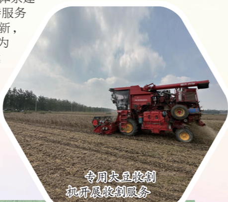
农机农具农具加梯农具的服务