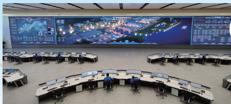
南京钢铁集团建成行业首个集制造、经营、生态于一体的智慧运营中心