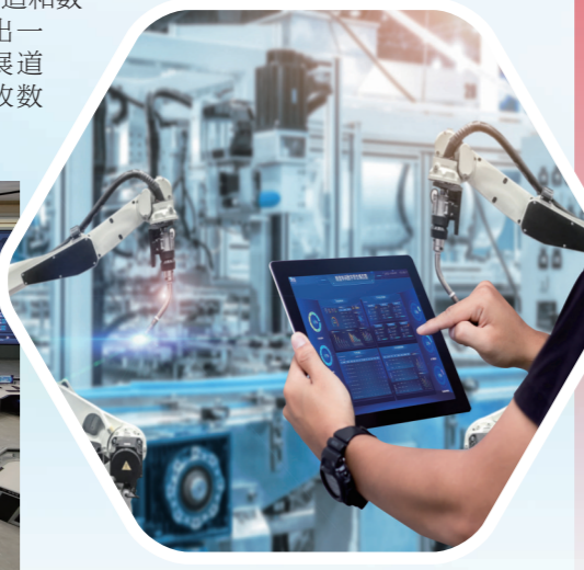
徐工汉云工业互联网平台助力数字孪生