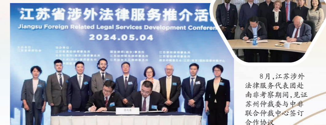
江苏省涉外法律服务推介会在香港举办