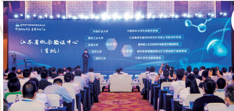
江苏启动建设首批10家省概念验证中心