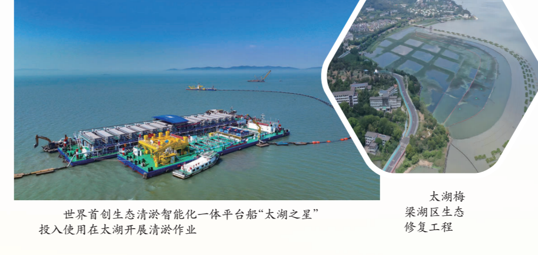
太湖梅梁湖生态修复工程