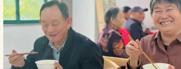
常州助餐“不断档”,老年人流行“社区”约个饭