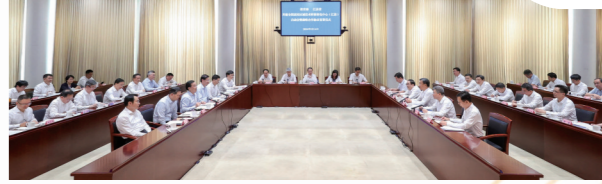
江苏省卓越工程师学院建设推进会暨新时代卓越工程师培养研讨会