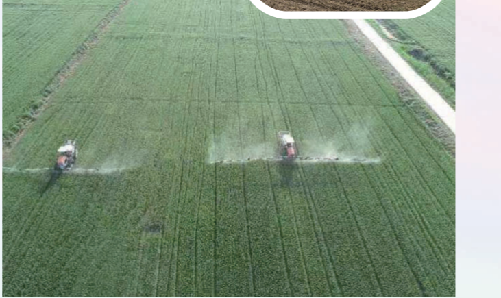
大型植保机在田间开展病虫害防治作业