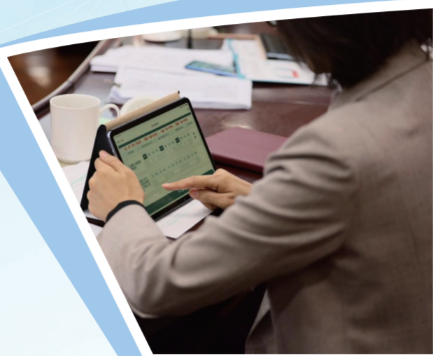
“数字人大”阅文系统

当今时代,科技浪潮汹涌澎湃,以移动互联网、大数据、云计算、人工智能等为代表的新一代信息技术迅猛发展,深刻改变了人们的生产生活。习近平总书记强调,要全面贯彻网络强国战略,把数字技术广泛应用于政府管理服务,推动政府数字化、智能化运行,为推进国家治理体系和治理能力现代化提供有力支撑。“数字人大”建设是实施“数字中国”战略的重要一环,江苏省人大常委会将推进“数字人大”建设工作放在重要位置,专门印发《江苏省“数字人大”建设行动计划》,不断推动数字化技术与人大履职行权深度融合,以数字赋能全省人大工作高质量发展。