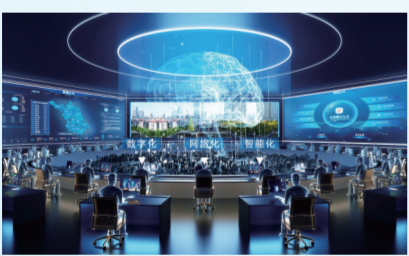
数字化网络化智能化