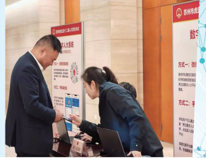
向人大代表说明如何使用数字人大系统