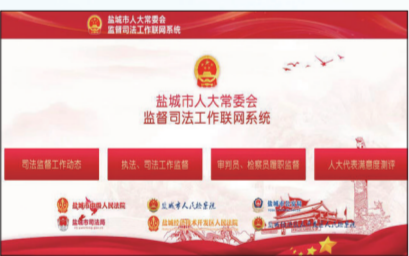
盐城市人大常委会监督司法工作联网系统