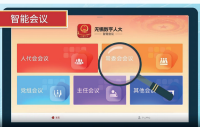
无锡数字人大智能会议模块