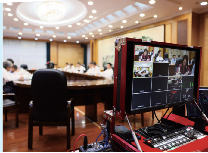
常委会分组审议视频录制